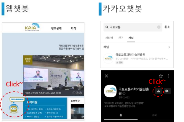
<KAIA 챗봇 접속 경로>

* 교육만족도 조사 위치 : KAIA 홈페이지 및 카카오톡채널 'KAIA 챗봇' 내