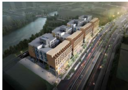
< 모듈러주택단지 조감도 >