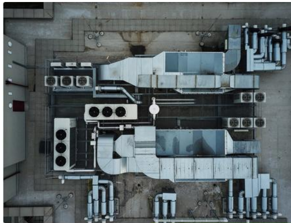
[그림] 천연 냉매 기반의 히트 펌프