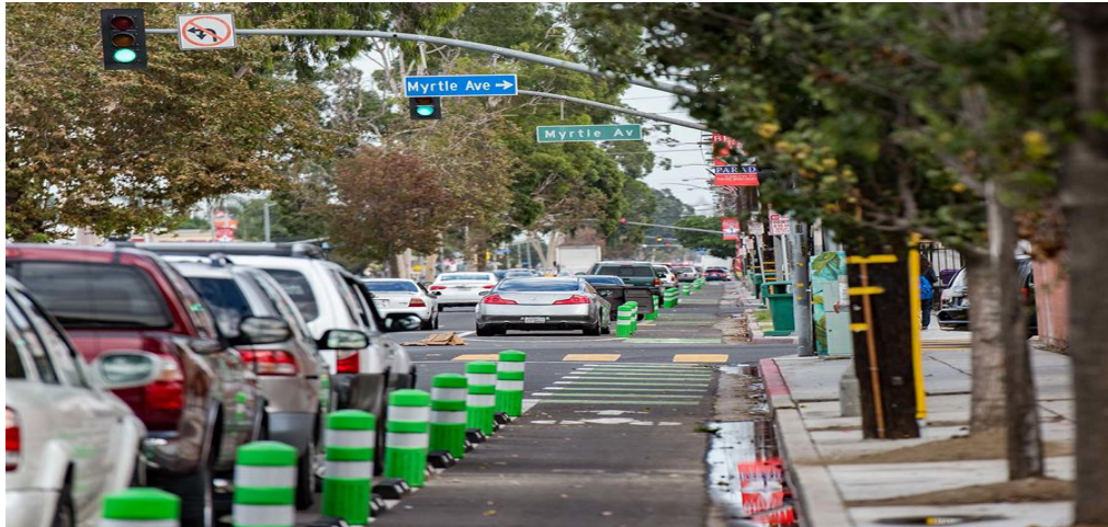
[그림] 런던 도시 내 자전거 전용도로