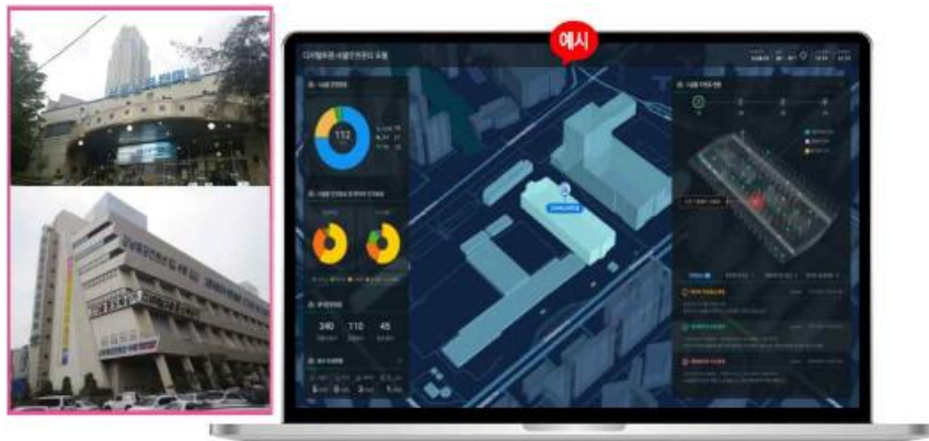
[그림] 다중이용시설 디지털트윈 시설안전관리 모델 시범적용 사례(서울고속터미널, 남부터미널)