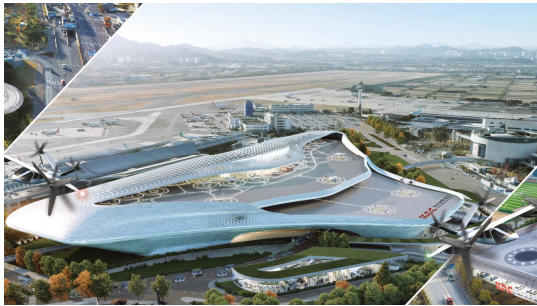
< UAM 이착륙장 Vertiport 조감도 >