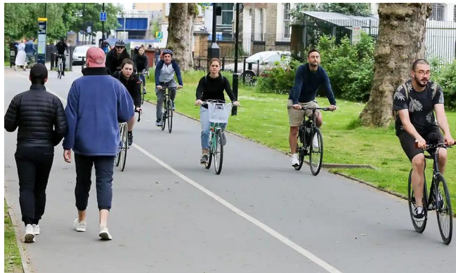
[그림] 런던시 시민들의 걷기 및 자전거 이용 모습