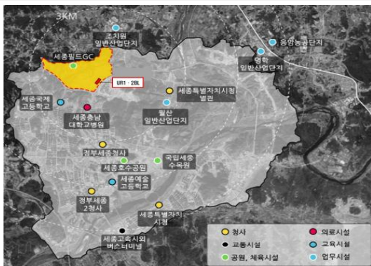
< 모듈러주택단지 위치도(세종시 6-3 생활권) >