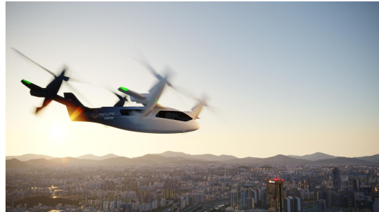
< 한화시스템·Overair 공동 개발 UAM 기체 >