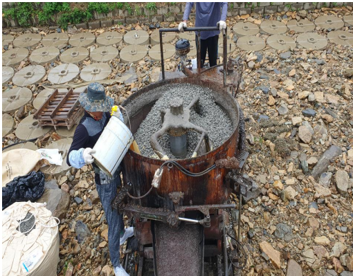
< 바이오폴리머-골재 혼합 과정 >