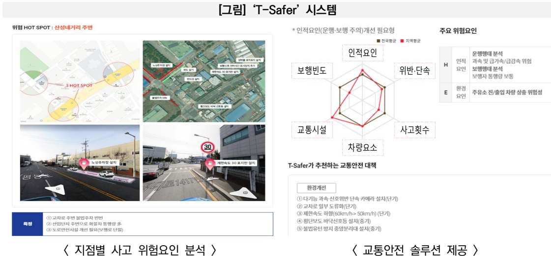
[그림] 'T-Safer' 시스템