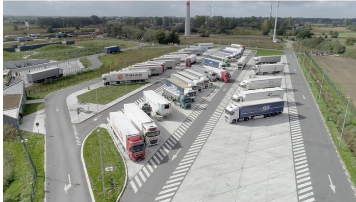
[그림] 대형화물 트럭의 주차 공간 개선