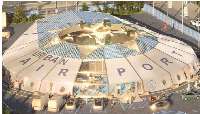
[그림] 영국 전기 수직 이착륙 항공기 공항