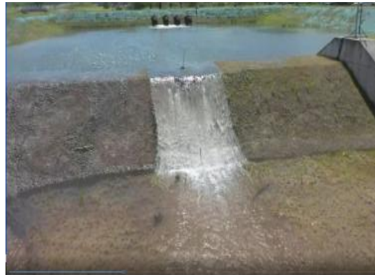
< 개발 공법 실험 장면 >