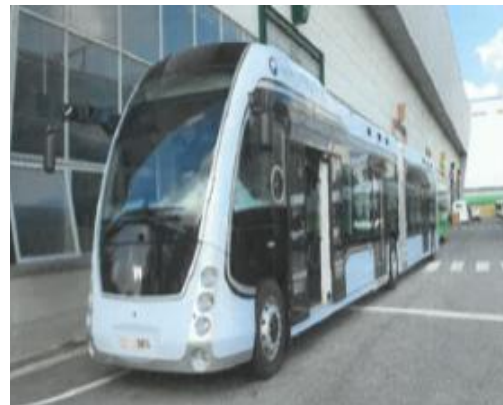
< 양문형 굴절버스 >