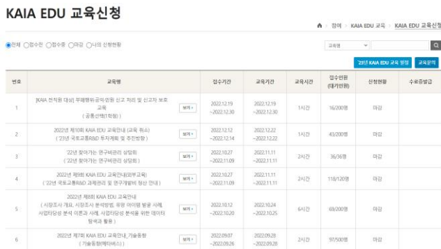
<KAIA EDU 교육 신청 화면>