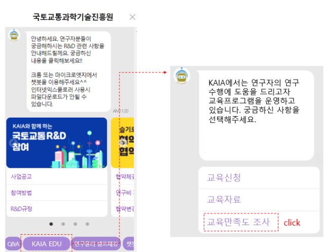
<KAIA 챗봇 '교육만족도' 위치>