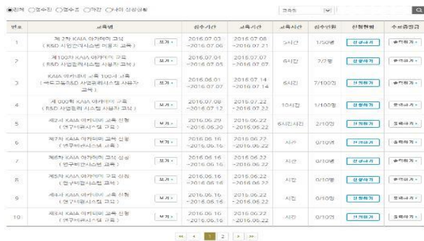
<KAIA EDU 교육 등록 화면>

* https://www.kaia.re.kr/portal/main.do - 참여 - KAIA EDU 교육신청