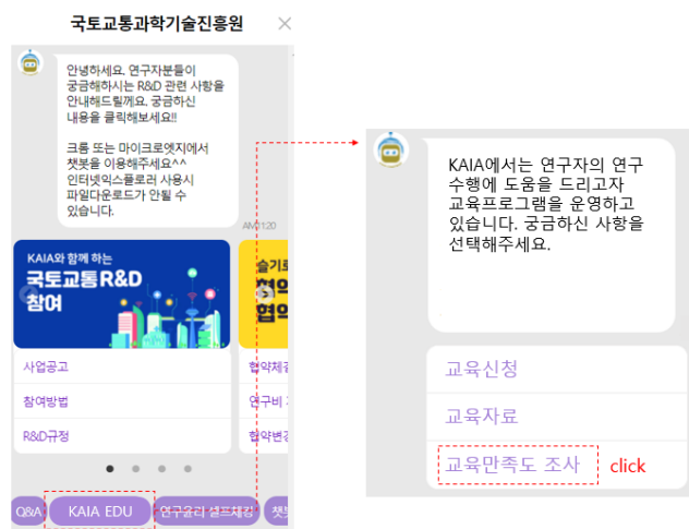
<'KAIA EDU 교육만족도' 위치>

* 교육만족도 조사 위치 : 국토교통과학기술진흥원 홈페이지 'KAIA 챗봇' 내