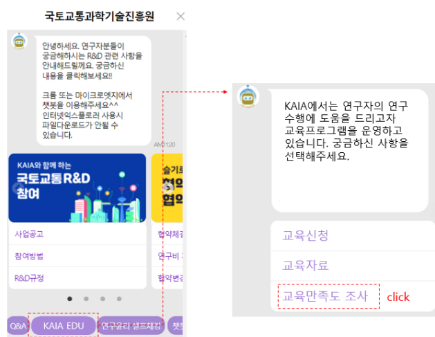
<'KAIA EDU 교육만족도' 위치>

* 교육만족도 조사 위치 : 국토교통과학기술진흥원 홈페이지 'KAIA 챗봇' 내