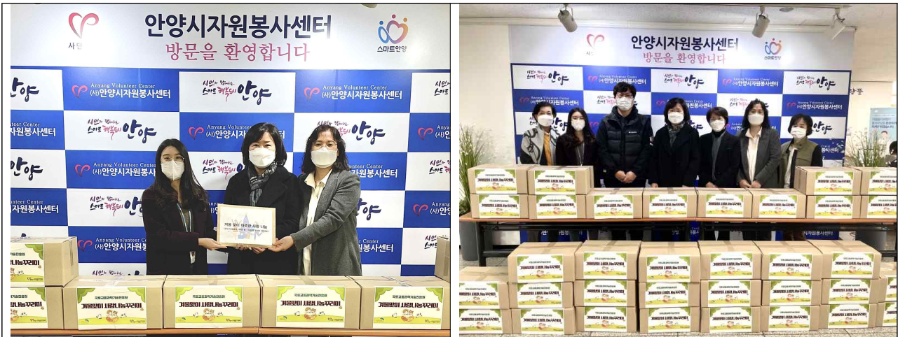
국토교통과학기술진흥원 임직원이 안양시자원봉사센터 관계자에게 상품권과 농산물꾸러미를 전달 하고 있다.