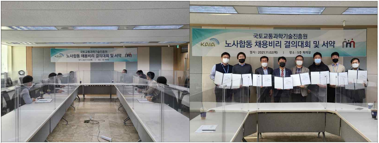
< 채용비리 근절 결의대회 사진 >