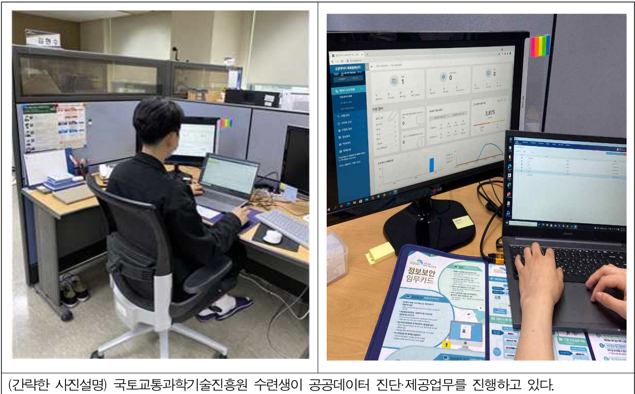
(간략한 사진설명) 국토교통과학기술진흥원 수련생이 공공데이터 진단·제공업무를 진행하고 있다.