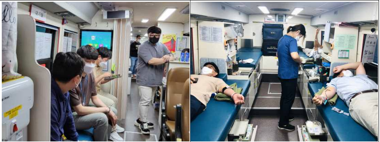
국토교통과학기술진흥원 임직원이 헌혈에 동참하는 모습