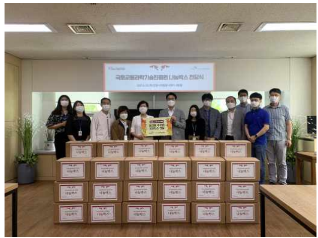
국토교통과학기술진흥원 임직원이 안양시자원봉사센터 관계자에게 물품을 전달하고 있다.