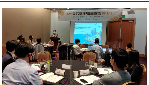
국토교통 투자도움협의체 회의 개최('21.5.26)