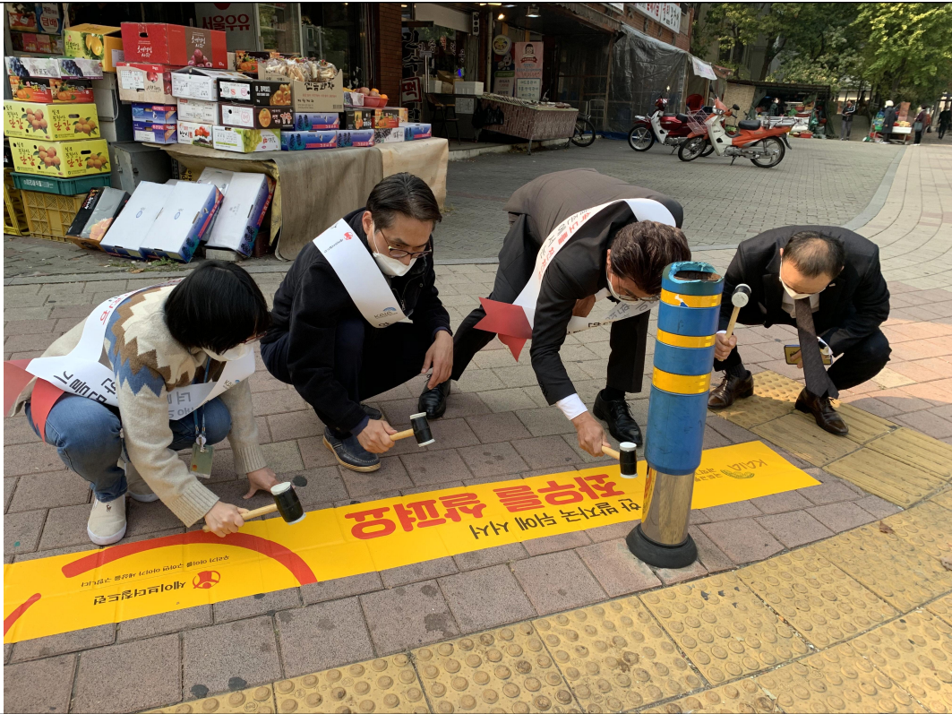
< 국토교통과학기술진흥원 임직원이 노란발자국을 설치하고 있다. >