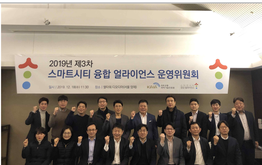
<얼라이언스 운영위원 및 협력기관 관계자>