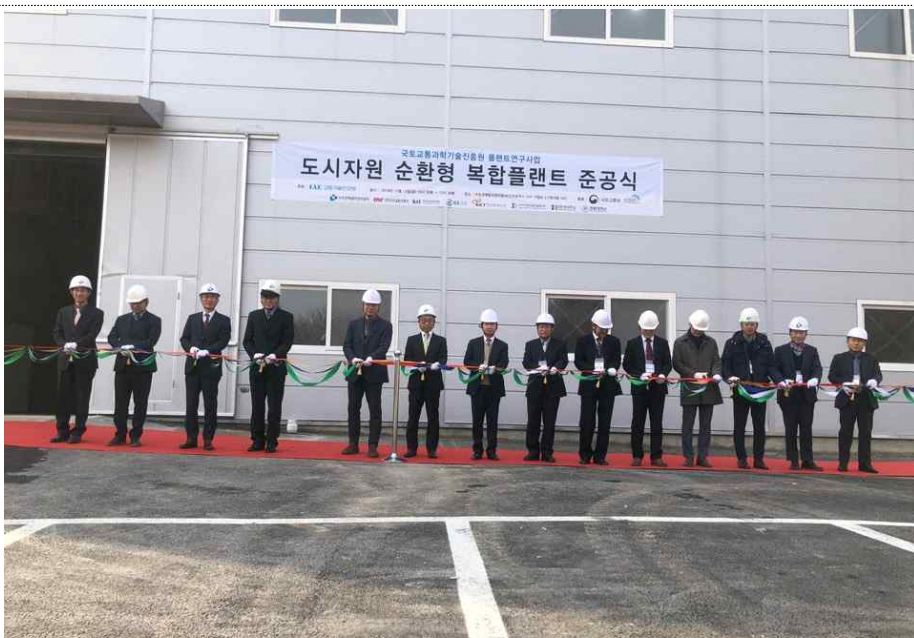
도시자원 순환형 복합플랜트 건설 준공식('19.12.13)